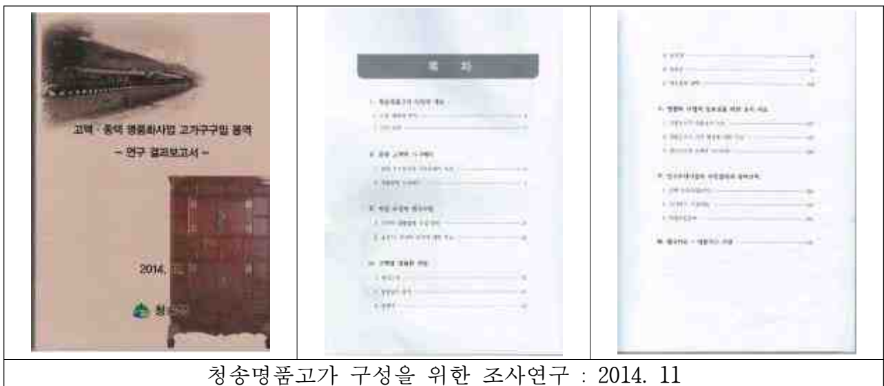
청송명품고가 구성을 위한 조사연구 : 2014. 11