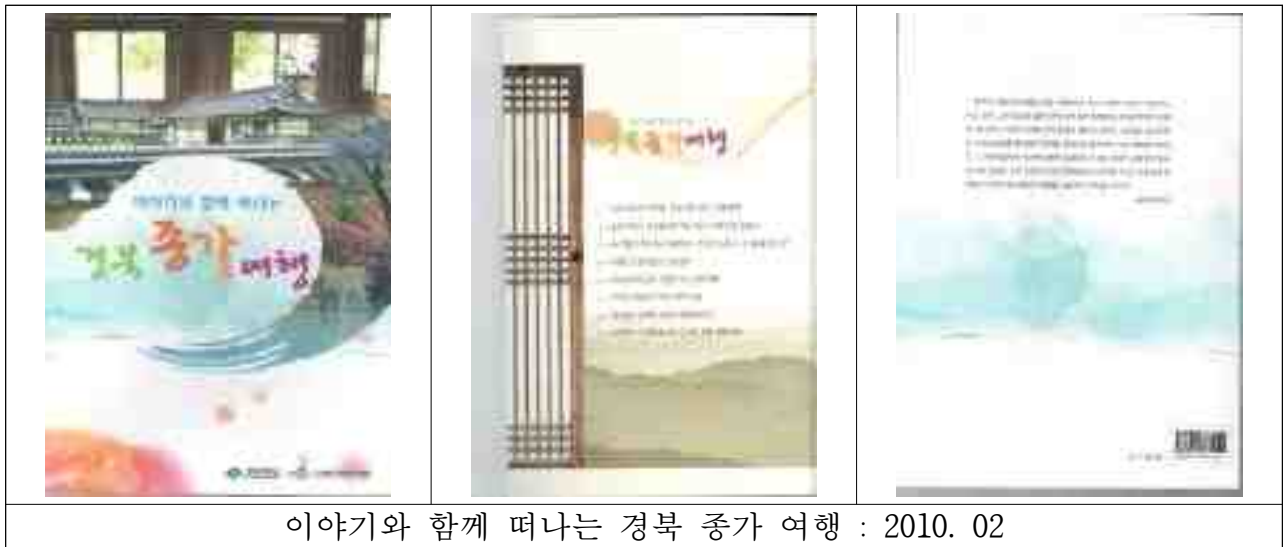
이야기와 함께 떠나는 경북 종가 여행 : 2010. 02